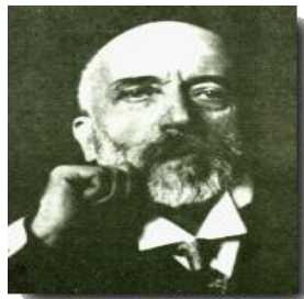
Dr. Andrija Mohorovičić učenjak, akademik i sveučilišni profesor